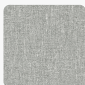
Textil Atlas K5805 GT Oberflächenstruktur GeoTex