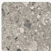
Chepe K5580 DP Oberflächenstruktur Deep Painted