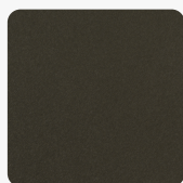
Idea FB86 ID Oberflächenstruktur Idea