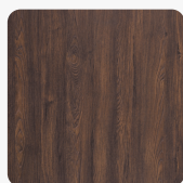
Makalo Teak K4342 AW Oberflächenstruktur Authentic Wood