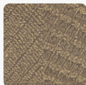
Halifax Eiche Zinn Q3176 RO