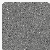
Granito anthrazit 4288 PE Oberflächenstruktur Perl