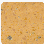
Aztec Gold GD

mehr Informationen https://at.jaf-development.com/shop/platte/mineralwerkstoffplatte--becken/mineralwerkstoffplatte/duPont-corian-mineralplatte-aztec-gold-gd-p58971