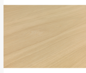
Eiche Mix, Brettoptik Oberflächenstruktur Furnier