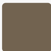
Mocca 1361 FH Oberflächenstruktur Feinhammerschlag