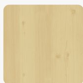
Astfichte 0175 NA Oberflächenstruktur Natura