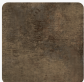
Patina Bronze 0794 NT