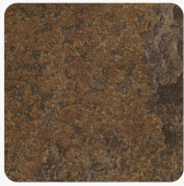
Ceramic Rusty F310 ST87 Oberflächenstruktur Mineral Ceramic