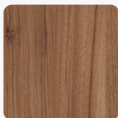
Noce Sizilia 37755 BS Oberflächenstruktur Office Structure