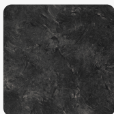
Schiefer 3953 PE Oberflächenstruktur Perl