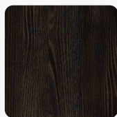
Thermo Eiche schwarzbraun H1199 ST12 Oberflächenstruktur Omnipore Matt