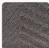
Sherman Eiche anthrazit Q1346 RO