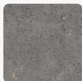
Pietra Fanano Grau F208 ST75 Oberflächenstruktur Mineral Satin