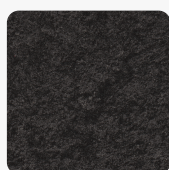
Mountain Basalt anthrazit F247 ST76 Oberflächenstruktur Mineral Rough Matt