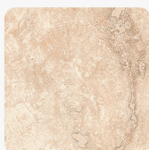
Margalida Travertin F030 ST75 Oberflächenstruktur Mineral Satin