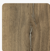
Halifax Eiche Zinn H3176 ST37 Oberflächenstruktur Feelwood Rift