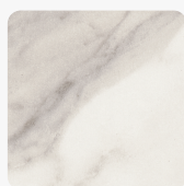
Kristallmarmor F800 ST9 Oberflächenstruktur Smoothtouch Matt