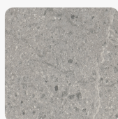
Candela Marmor hellgrau F243 ST76 Oberflächenstruktur Mineral Rough Matt