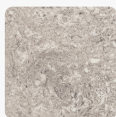
Calais Travertin F052 ST75 Oberflächenstruktur Mineral Satin