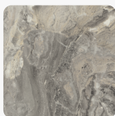
Cipollino Marmor grau F093 ST7 Oberflächenstruktur Smoothtouch Fine Pearl