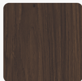
Casella Eiche Marone H1369 ST40 Oberflächenstruktur Feelwood Oakgrain