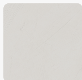
Gypsum Hell 2325 IM Oberflächenstruktur Immago