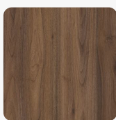
Panorama Nussbaum Dunkel 0955 PM Oberflächenstruktur Pore Matt