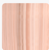
Bleached Nuwood BLW