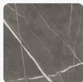
Pietra Grey K4892 DP Oberflächenstruktur Deep Painted