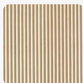
CURVED Birke Oberflächenstruktur Furnier