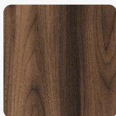
Nuss Tortona 32339 AN Oberflächenstruktur Authentic Nature