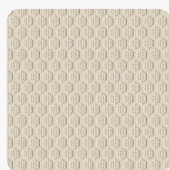
Sandfarben 0066 NH Oberflächenstruktur Hexa