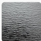
CRASHED Silver SL Oberflächenstruktur STRUCTURE-LINE