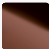
Bronze DM Oberflächenstruktur DECO-LINE