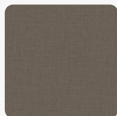
Cross Brass K5801 GT Oberflächenstruktur GeoTex