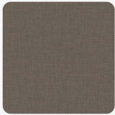
Cross Brass K5801 GT Oberflächenstruktur GeoTex